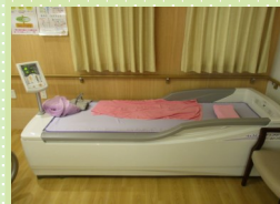
リラクゼーション